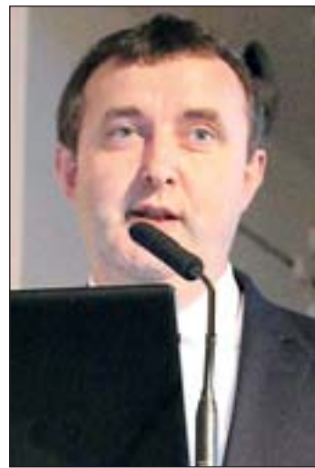
Dr. Palkovics László

A Köznevelési Kerekasztal kétezer iskolában végzett felmérésének eredményéről elmondta, a problémák között első helyen jelölték meg, hogy a pedagógusok nem érzik magukat biztonságban. Második helyre a tartalmi gondok, ter-