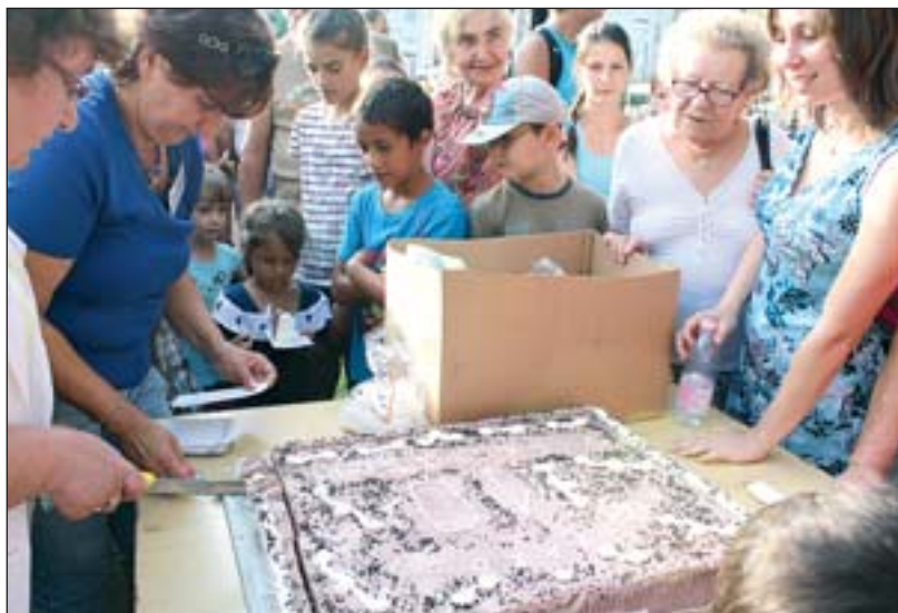
Óriástorta a Kertvárosi Vigasság rendezvényén.

bűvészmsóra okozott még derűt a délután folyamán, hétrébás feladatok vártak a harcos párokra. Közben a jótékonyági főzésen számos csa-