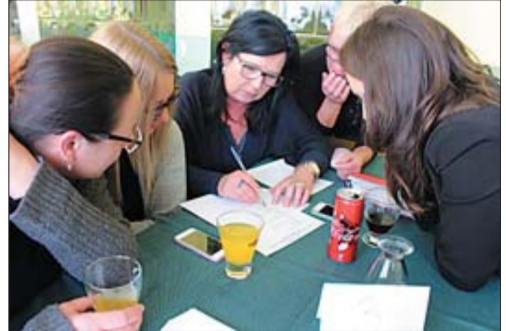
A nyertes pölskei csapat.

A Magyar Kultúra Napját 1989 óta ünnepeljük meg január 22-én, annak emlékére, hogy Kőlcsey Ferenc 1823-ban ezen a napon fejezte be a Himnusz kéziratát. An-