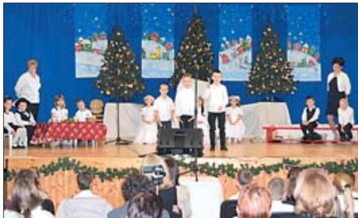
A Szivárvány Óvoda gyerekeinek karácsonyi műsora.

– Történhet előrelépés a hegyi utak felújítása terén is.