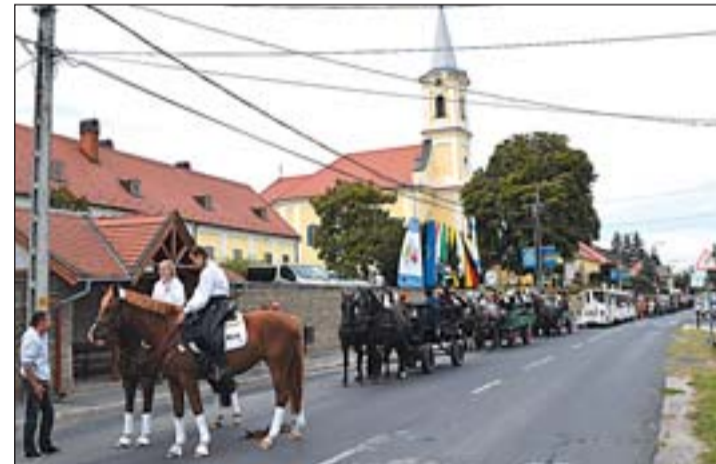
A szüreti felvonulás menete Alsópáhokon.

ben iskolakezdési támogatást nyújtunk, a felsőoktatásban tanulóknak Bursa Hungarica önkormányzati ösztöndíjat biztosítunk. A hetven év feletti idős rászorulóknak hatezer forintot adtunk karácsonyra, hozzájárulva az ünnepek kiadásaihoz. Emellett a napi problémáik megoldásában is segítünk az időseknek, különösen most, a hó eltakarításában házaiknál. A BM-pályázaton 55 köbméter tűzfát szereztünk be, melyet szétosztottunk már a rászorulóknak között. Karácsony előtt valamennyi