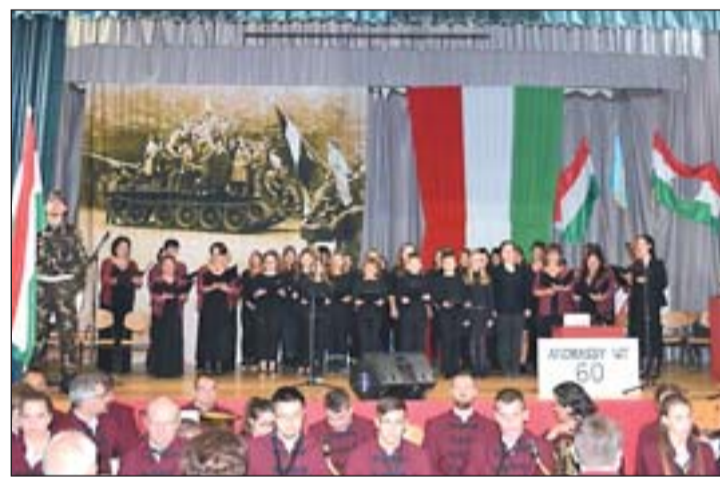
56-os megemlékezés a művelődési házban.

maztunk. A Magyar Közút tulajdonában lévő úton komplett rekonstrukciót hajtottak végre a padkák és a vízelvezető árkok rendbetételével. Az úttest teljes szélességben új aszfalttréteget kapott. A helyreállítás óriási jelentőséggel bír, mert szolgálja a falu felső részén lakókat, kedvet ad az új házat, otthont építeni szándékozók számára, másrészt sokan közlekednek ezen az összekötő úton Szentgyörgyvárról is, Keszthely és Hévíz felé munkába. Hivatalos átadását november 23-án tartjuk.