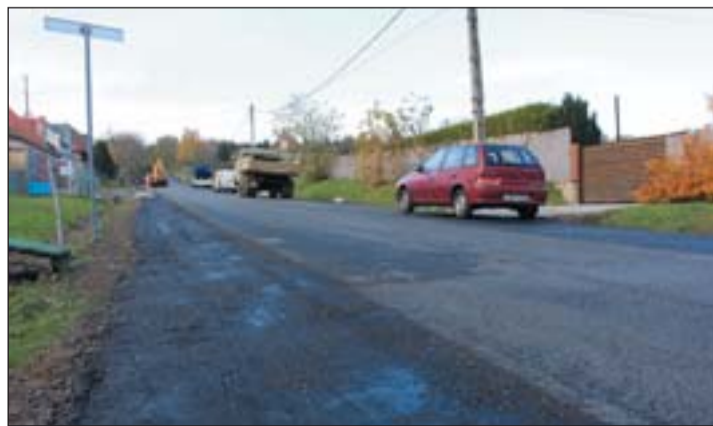
Helyreállítják a nemesboldogasszonyfai utat.

Nagy fontossággal bír, hogy idén a nemesboldogasszonyfai falurész Tölgyfa utcájában megtörtént a