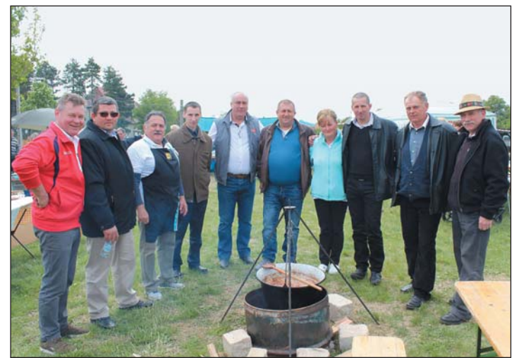
A vajdasági Adorján küldöttségét első ízben köszöntötték a cserszegtomaji képviselők Cserszegtomajon.

az utolsó hét évben. Cserszegtomaj adóévi mutatója magas, az érvényben lévő pályázati szerkezet a legtöbb esetben nem a mi extrém településszerkezetünkre lett kitalálva, sajnos sokszor már a kiírásokba sem férünk bele. Folyamatosan dolgozunk, hogy a beadott pályázatainkkal kapcsolatban sikereket tudjunk felsorolni. Szeretnénk azért egy TOP-os pályázaton megnyerni a napi 80–100 adag meleg étel házhoz szállítására alkalmas gépjárművet, és útfelújításban is segítség lenne.