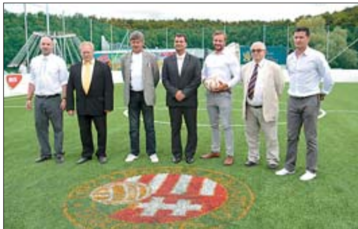
A tavaly átadott műfüves pályán ismét focitornát rendeznek.

smaragd-fa-mozgalmat, melyről bővebb információ található a www.nagypali.hu honlapunkon. Idei fejlesztésünk közé tartozik a térkövezett sétány kialakítása a temetőben, ami elkészül Napkorona fesztiválunkra.