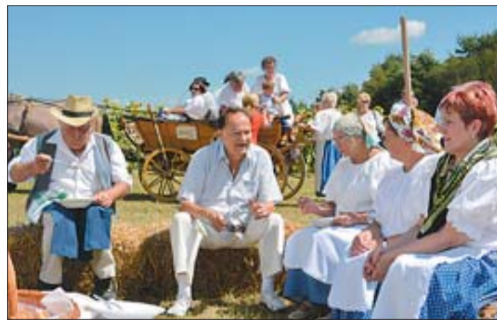
A tavalyi Napkorona Fesztivál gazdanapján dr. Torgyán Józseffel.

– Valóban, a közelmúltban az ausztriai kaindorfi ökorégió rendezvényére kaptunk meghívást. A szervezettel a Nyugat-dunántúli Ökorégió Alapítványon keresztül működünk együtt. Egy határon átnyúló, három országot érintő ökotudatosságot szorgalmazó projektben a Soproni Egyetemmel veszünk részt. Kiválasztott település lettünk a Magyar Tudományos Akadémia kutatók szemponyjából. Három munkatársuk vidékfejlesztési tanulmányt készített a Zöld út programban kitűzött innovatív irányokról, a már megvalósult fejlesztésekről és a további tervekről. Ha már az innováció szóba került, meg kell említenem a szomszédban épülő zalaegerszegi járműipari teszt pályát, ami az idegenforgalom és más területeken is hozhat számunkra új lehetőségeket.