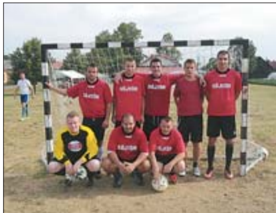
A zsitkóci kispályás futballtornán.

A Söjtöri Deák Ferenc SE futballcsapat tagjai szintén júniusban