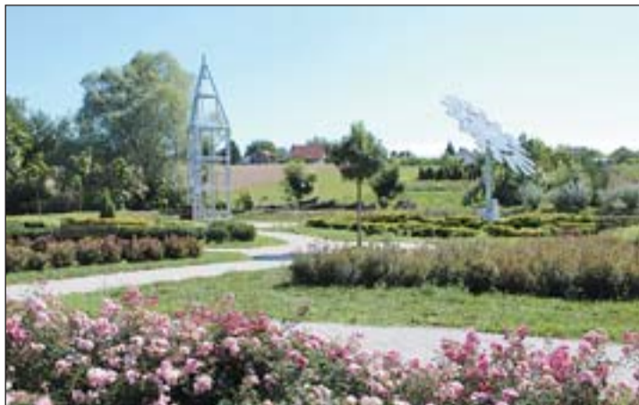
Az új kísérőmű váza már elkészült a napraforgó mögött.

zatunk gazdálkodási tevékenységét, amit az alma- és körteültetvényvel erősíteni kívánunk. A dolgot egyedisége nem csupán ebben rejlik, ugyanis 400 darab smaragd-fát is betelepítettünk az alma- és körtefák közé. Ezt kísérleti jelleggel tettük, mert vizsgálni szeretnénk, hogy ebben a szimbiózisban, hogyan hatnak egymás fejlődésére ezek a növények. Várható-e termésmennyiség-növekedés vagy minőségi javulás a gyümölcsök esetében az öko-fa kedvező mikroklímájának hatására. A smaragd-fák gyökérzónáiba talajbaktériumokat is juttattunk. Ezen felül a kísérlet része, hogy szén-dioxidból oxigént állítsunk elő. A szén-dioxidot tartályokból csöveken keresztül vezetjük a smaragd-fa nagy levelei közé, ami oxigénné alakul a fotoszintézis segítségével. A smaragd-fának, mint öko-fának fontos szerepet szánunk, ezért indítottuk el az önkormányzatok körében a