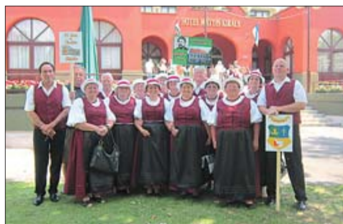
Az Arany Minősítést kapott népdalkör Hajdúszoboszlón.