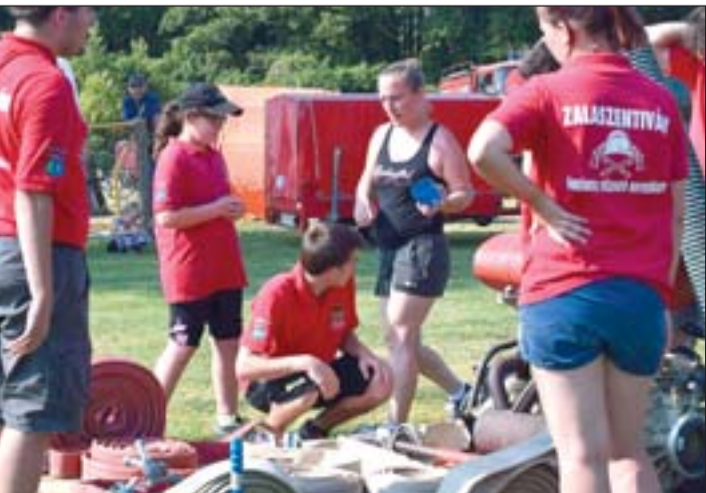
Szerelnek a zalaszentiváni tűzoltók.

– Kiket kívánnak megszólítani? – A projekt kiemelt célcsoportja a mikrotérségben élő gyermekes szülők, házasságkötésre, gyermekvállalásra készülő párok,