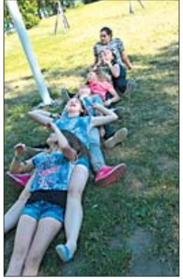
Egervölgyi sulisok Fonyódon.

– Ennek köszönhetően a szakmai és az órai munka kicsit összefogottabbá vált, haladunk a tanulói tevékenységen alapuló pedagógiai