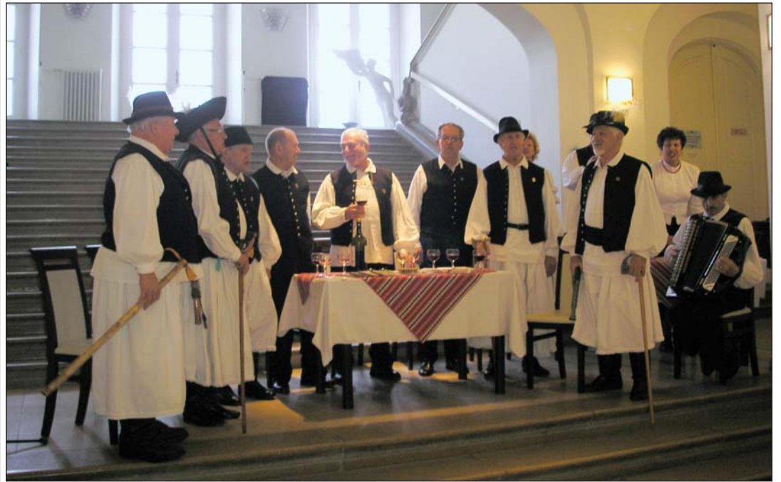
A fenti címmel nyílt május közepéig látogatható időszaki tárlat a Balatoni Múzeumban március derekán.

A nagykanizsai Thury György Múzeum (NTGYM) és a Balatoni Múzeum közös kiállítása a ma is vonzó, kalandosnak képzelt, valóságosan inkább tragikus betyársorsok oldaláról mutatja be, hogy a katonáskodás, annak kikerülése, a viszontagságos és a sokféle formában, tartalommal megjelenő betyárkodás milyen szoros kapcsolatban, kölcsönhatásban volt egymással a 18–19. században. A sok érdekes tárgyat felvonultató tárlat – melyen a Gyenesdiási Dalárda tagjai nótáztak – a két zalai intézmény egymást kiegészítő tárgyi anyagát hozta egy fedél alá, a megyei levéltár segítségével.