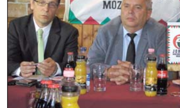
Felvételünkön bal oldalon a Jobbik-jelölt.

t magát. A béruniót szorgalmazó, értékalapú politizálásban érdekelt jelölt úgy látta, a közbeszerzési törvény a korrupció melegágya. A térségben is mielőbb megoldandó feladatnak mondta az elvándorlást, a munkahelyek teremtését, a látványberuházások megállítását, a turizmus fel- lendítését.