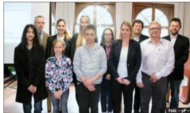
Adys és bibós diákok a díjkiosztón.

NAPI LEGJOBB ÁRON, 1 ÉV GARANCIÁVAL Zalaegerszeg-Zalabesenyő, Hegyi u. 17. Telefon: 30/9373-638