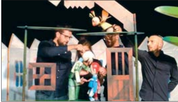
Zajlik a próba a bábszínházban.