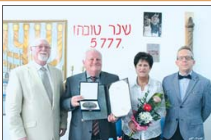
■ A hagyományokhoz híven a zsidó újév alkalmából ismét átdadták a zalaegerszegi hitközség és a „Remény” Közalapítvány által létrehozott „Másokért” emléktáblát.

Decemberben pedig a tavalyi évben is nagy sikerek örvendő