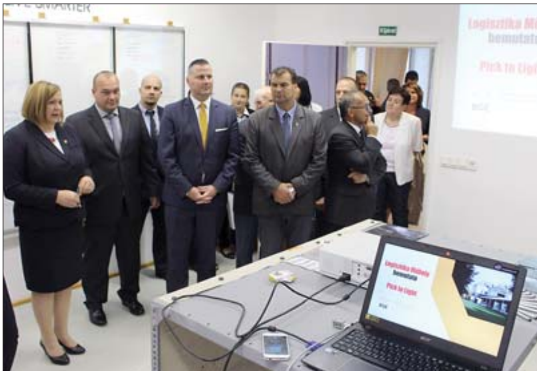
■ A Budapesti Gazdasági Egyetem zalaegerszegi gazdálkodás kara 47. tanévet kezdte meg. A múlt keddi tanévvnyitó ünnepségen köszöntötték az elsős hallgatókat, valamint felavatták a vállalati együttműködés jegyében kialakított Pick to light logisztikai labort.