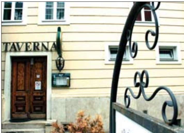
Az új helyszín.