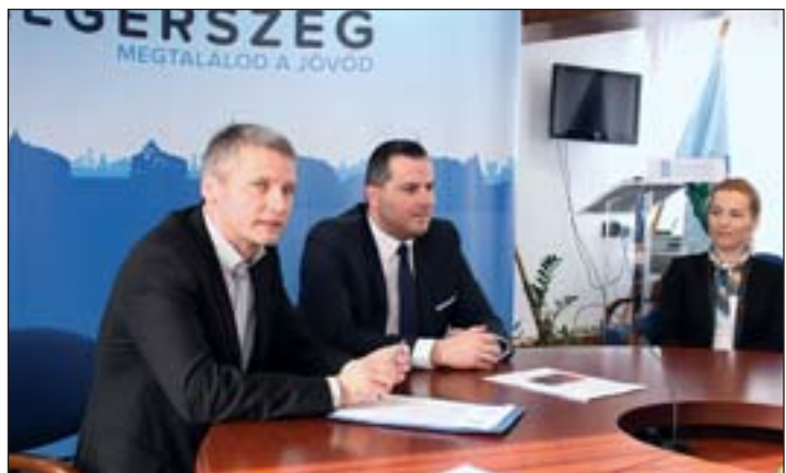
Kara Ákos államtitkár a sajtótájékoztatóján.

lyázatok standard elbírálásúak, így a követelmények megfelelése mellett a beérkezési sorrend is számít. Közülük a legnagyobb a mint-