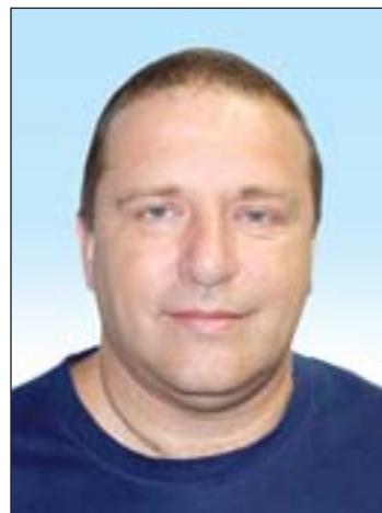
adók. Nálunk nincsen rájátszás, így minden mérkőzésre nagyon oda kell figyelnünk.

– A téli szünet nem alakult jól a számunkra, többen bajlódtak sérüléssel, betegséggel. Bizakodom, hogy rövidesen mindenki a rendelkezésemre áll. A tavasz során először könnyebb ellenfelek következnek, a végén lesznek a rang-