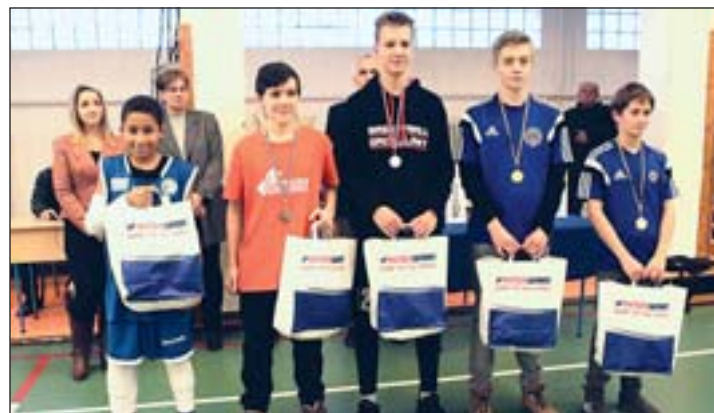
OSE Lions–ZTE KK 22-59, Oberwart Gunners–Soproni Sportiskola hu. 41-42, ZTE KK–Soproni Sportiskola 53-38, OSE Lions–Oberwart Gunners 47-42.

Eredmények: ZTE KK–Oberwart Gunners 46-24, OSE Lions–Soproni Sportiskola 44-41,