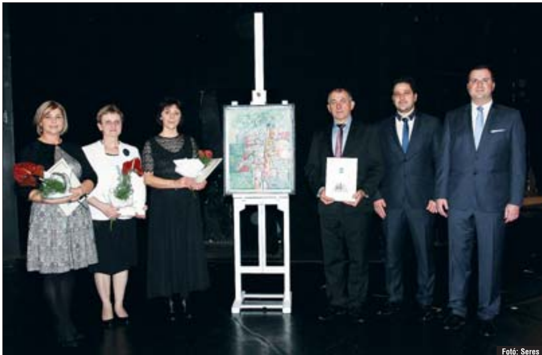
Együtt a díjazottak.

A gálaest idén a tánc – főleg a klasszikus balett és a modern tánc