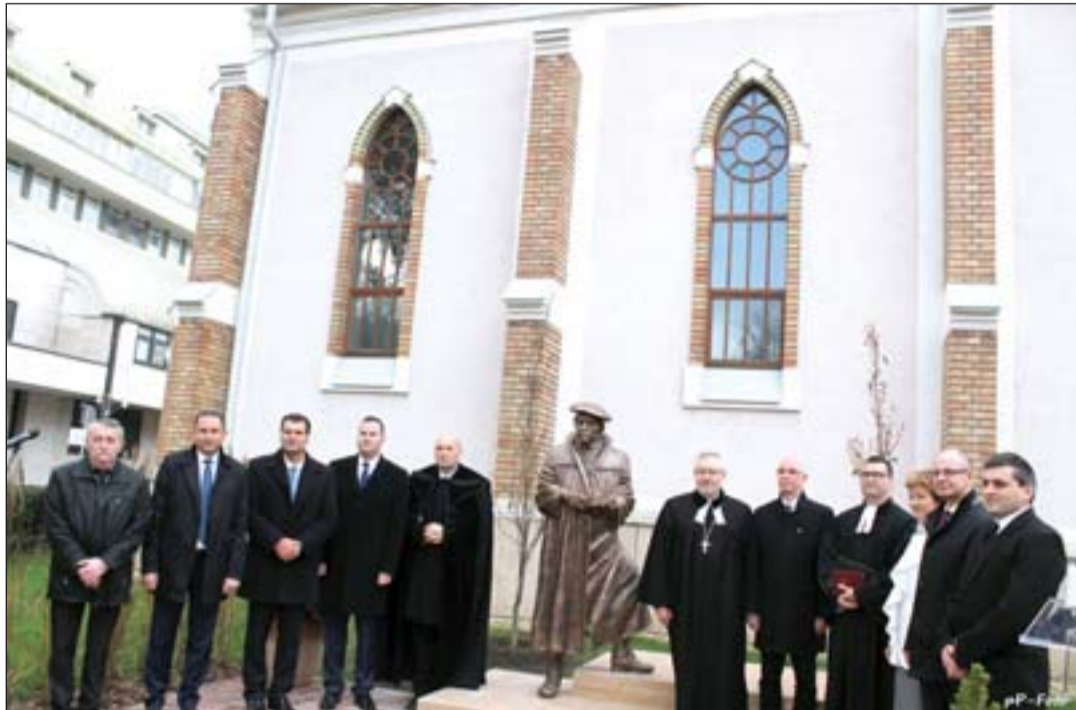
A reformáció 500. évfordulója alkalmából állítottak szobrot Luther Márton emlékére az evangélikus templom melletti téren. Zalaegerszeg új köztéri alkotását Farkas Ferenc szobrászművész készítette.

KÉSZÜLŐDÉS MINDENSZENTEK ÉS HALOTTAK NAPJÁRA