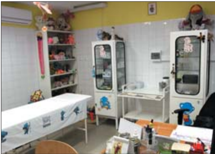
Orvosi rendelők újultak meg.