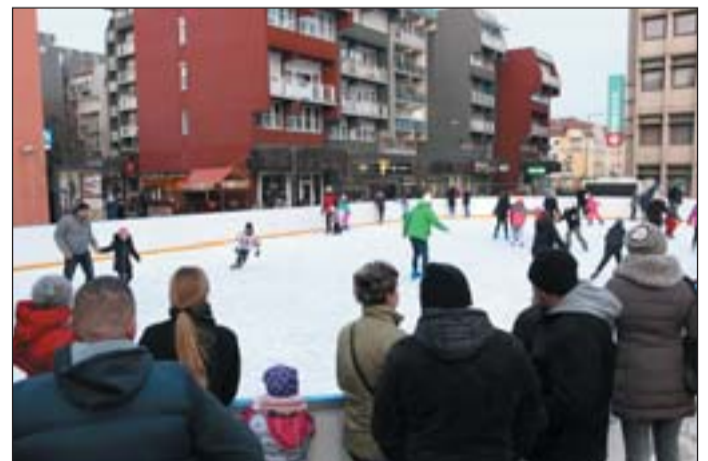
Jégpálya az adventi időszakban.