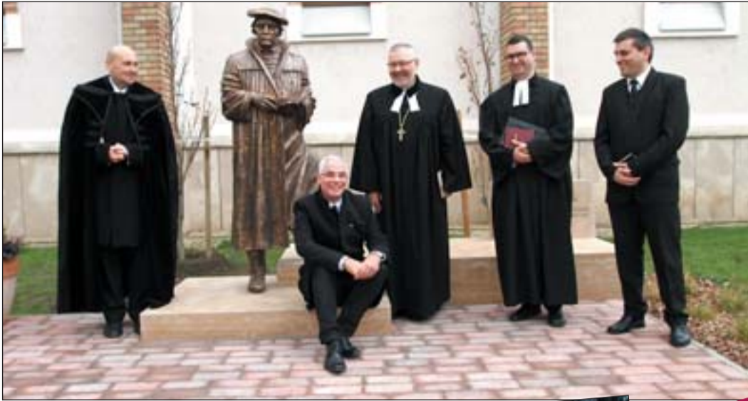
A Luther Márton-szobor avatása.