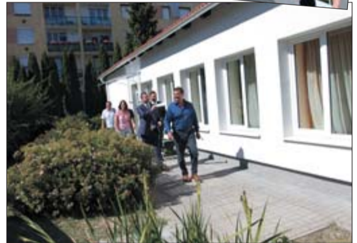
Megújult az idősek kulbja.