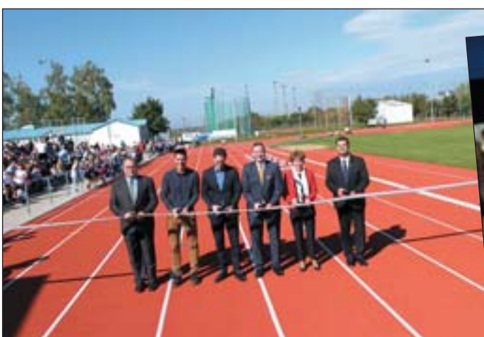
Rekordánborítású atlétikai pálya átadása.