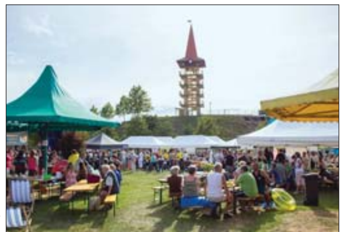
Jóteknysági nap az AquaCityben.