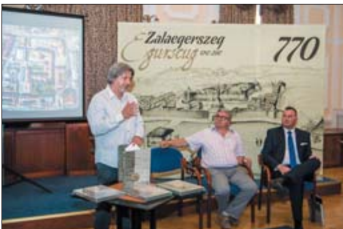
A Zalaegerszeg története című könyv bemutatása.