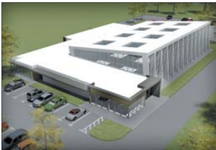
A létesítendő új oktatási komplexum látványterve.

valósítja meg a TOP-programból, melynek engedélyes kivitelei tervei már rendelkezésre állnak. A 21. századi infrastruktúrájú új képzőközpont az egyetem területén kap helyet, a Ganz-Munkácsy Szakgimnázium és Szakközépiskola szomszédságában, miután tanulóink zöme innét kerül ki. Természe-