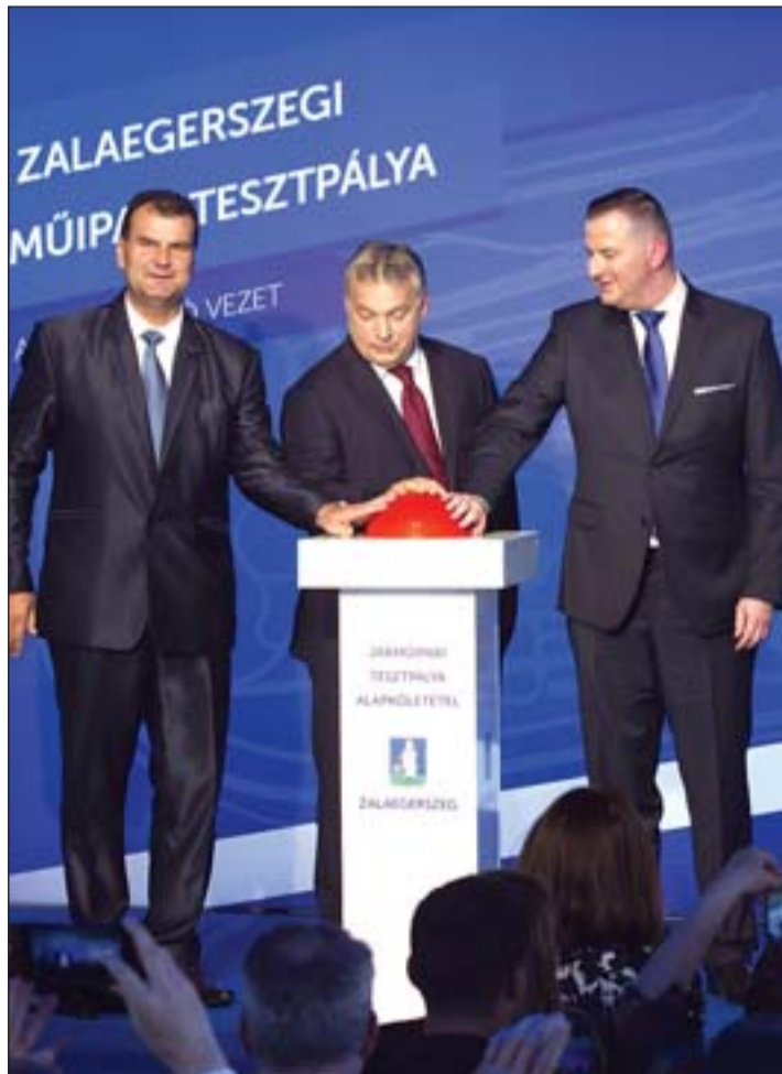
Tesztpályaépítés – alapköletétel.