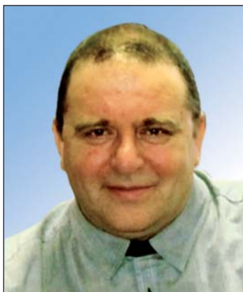
– A gyengébb szezon után változhat a játékoskeret, lehetnek távozók, érkezők?

– Sajnos, nem indulunk. Legfeljebb akkor, ha az előttünk lévő csapatok közül valaki visszalép, erre kevés az esély. A következő idényt egyértelműen a csapat építésére kell fordítani, vissza kell találnunk a helyes útra.