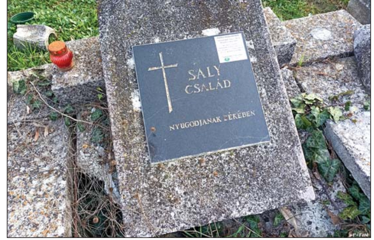
Felújítják a sírhelyet.

Balaicz Zoltán elmondta: döntöttek a 2024-es városi költségvetés első negyedéves módosításáról, a városi költségvetés 2,78 milliárd forinttal emelkedett állami támogatások és megemelt normatív hozzájárulások révén, a főösszeg 51,3 milliárd forintra emelkedett. Egyszerűsödött az Egerszeg-kártya kedvezményeit meghatározó rendelet, amely ezentúl csak százalékos arányokat állapít meg. (A legtöbb helyen a belépőjegyek árából a kedvezmény 20 százalék, de a termálfürdő esetében például 30 százalék.) A polgármester utalt arra, hogy rendszeresen felvetődik a kérdés, miért csak az állandó lakcímmel rendelkező zalaegerszegiek igényelhetik Egerszeg-kártyát. Mint fogalmazott, azért van ál-