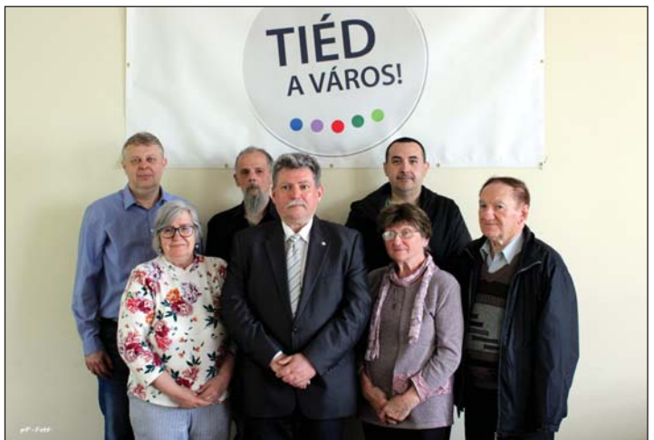
A jelöltek egy csoportja.