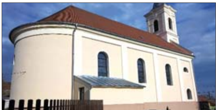
A Sarmelléki Római Katolikus Plébánia a Mezőgazdasági és Vidékfejlesztési Hivatal vidéki örökség megőrzésére kiírt pályázatán tízmillió forint támogatást nyert el a helyi, XIV. században alapított Keresztelő Szent János-plébániatemplom külső felújítására.

A pályázati összegből a templom külső falfelületét sikerült felújítani. A felázások megszüntetése után, a levert vakolat helyére új került. A templom színes ólomüveg ablakai elé új, külső védőablakokat helyeztek be, ezzel kiváltva a régi repedezett darabokat. A párkányok bádoglemezmelése is elrozsásodott, ezért új bádoglemezeket helyeztek fel, illetve a régi védőfestését is elvégezték. A templom a mai klasszicista formáját 1839-ben