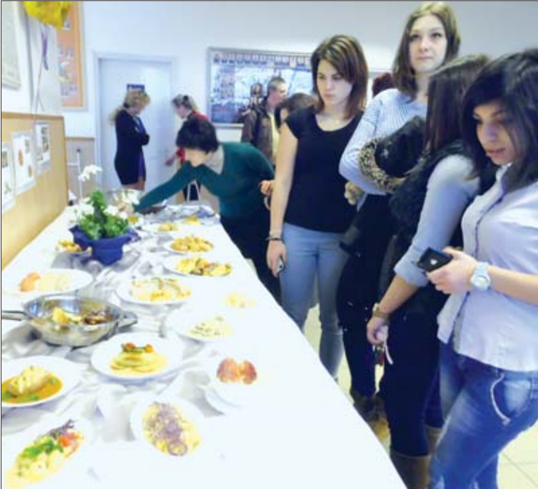
A napokban rendezte a Pannon Egyetem Keszthelyi Georgikon Kara az immár hagyományos Burgonyaágazati Fórumot.

Az országos érdeklődésre számot tartó szakember-találkozóra a jól bevált módon, kerekasztal jelleggel kerül sor, biztosítva a lehetőséget az aktív részvételre a kutató, termelő és kereskedő szférában. Mindamelllett, hogy a Földművelésügyi Minisztérium, a Mezőgazdasági és Vidékfejlesztési Hivatal, a Nemzeti Agrárkamara, a Nemzeti Élelmiszer-biztonsági Hivatal előadói átfogó képet adtak szakigazgatási ügyekről, pályázati aktualitásokról, szaknacsadási rendszerek működéséről, a fórum ezúttal gasztronómiai képviselővel is kiegészült. A természet végeredményét reprezentáló kihelyezett eseményre a Vendéglátóipari Szakképző Isko-