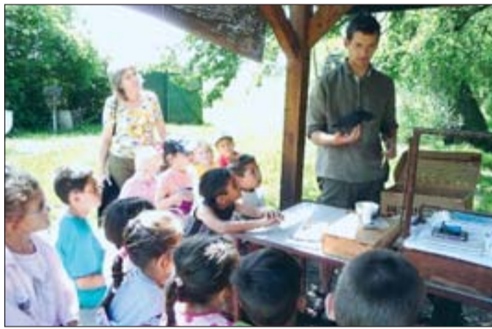
Tóparti foglalkozás a fenékpusztai madármegfigyelő helyen.

Keszthelyen január 19-én zárult a város és környéke óvodásainak és iskolásainak civil szervezésű, oktatási-nevelési intézményeken kívüli ismeretterjesztő programja.