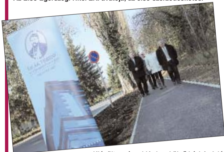
Kiépült a pózvai járda a külső kórház felé.