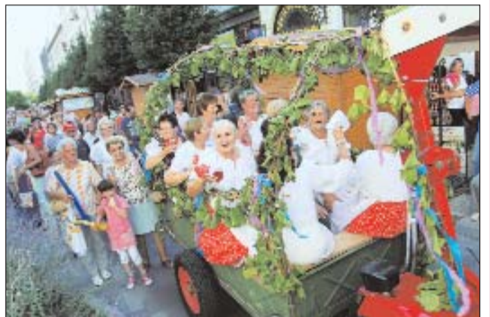
VI. Belvárosi szüret és Zalai teríték.