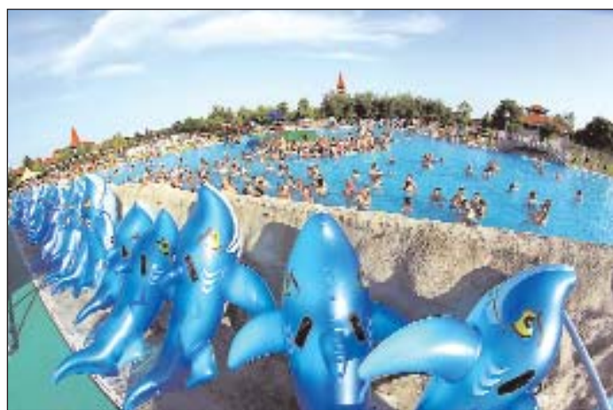
Zala megye legkedveltebb nyaralóhelye 2013-ban Zalaegerszeg.