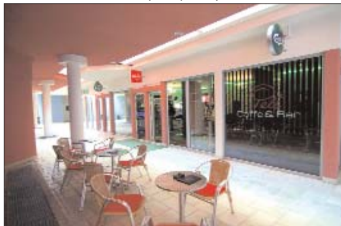
Felavatták a Csepke Passzázst.