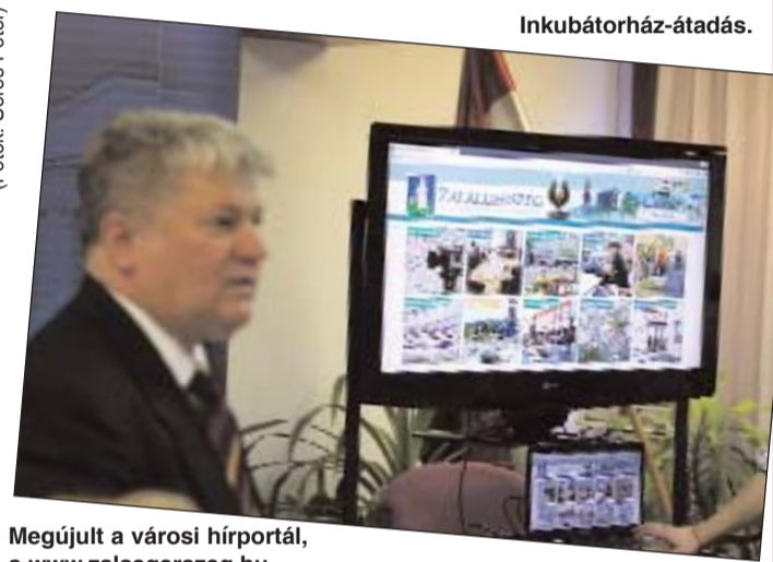
Megújult a városi hírportál, a www.zalaegerszeg.hu .