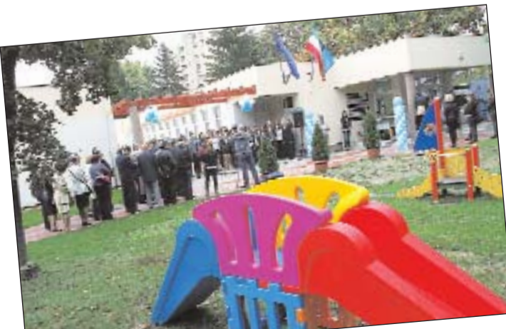
Átadták az Úrhajós Úti Bölcsöde új szárnyát.