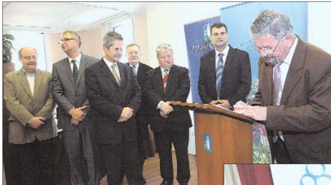
Az Első Egerszegi Hitel Zrt. avatója, az első szerződéskötés.