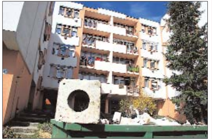
Folytatódott a gyűjtőkémények cseréje program.