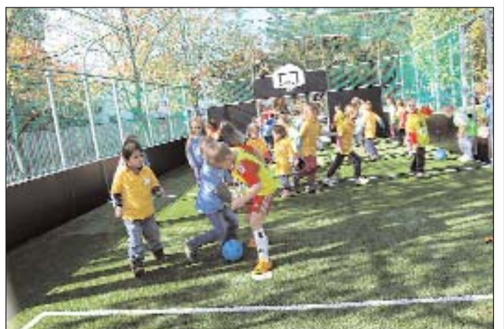
Műfüves focipálya avatása a Kis Utcai Óvodában.