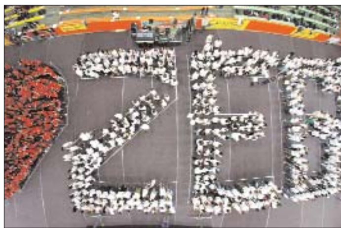
I LOVE ZEG – diákok alkotta élőkép a sportcsarnokban.