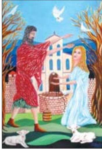
Szent Márton megkereszteli édesanyját