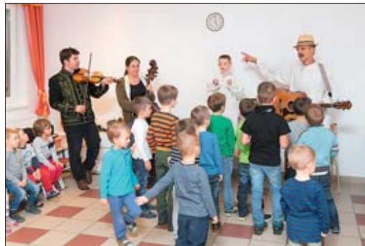
Márton-napi családi multság az oviban.

Turisztikai és TDM-pályázatok mellett kezdeményeztük az '56-