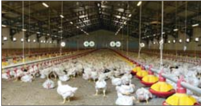
Nagy létszámú pecsényecsirke állomány.

A téma fontosságát egyebek mellett az adja, hogy a hazai hústermelés több mint felét a baromfi-hús teszi ki. A baromfi-hús termelés közül is legmeghatározóbb a pecsényecsirke (brojlercsirke) előállítás, aminek esetében a hazai szükséglet 170%-át állítjuk elő, tehát több mint másfélszer annyit termelünk, mint amit elfogyasztunk. A járvány miatt 2017-ben jelentősen csökkent a víziszárnyas kibocsátás (20–35%) az előző évihez, azonban 2018-ra már jelentős növekedést prognosztizálnak a szakemberek. Libahús termelés tekintetében hazánk Lengyelország után a második helyet foglalja el Európában. A nálunk termelt libahús nagy része Németországban kerül fo-