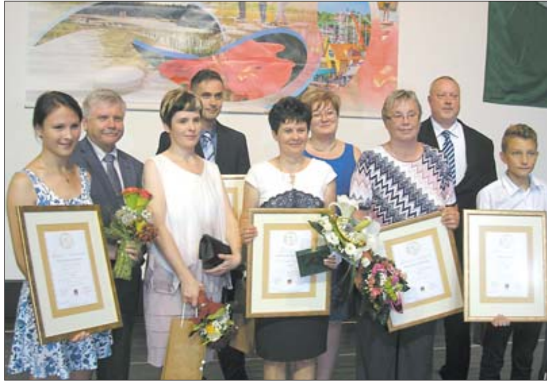
A város kitüntetettjei a polgármesterrel

Tófejen több évre visszatekintő hagyomány, hogy a település falunapján vendégül látják az erdélyi Gyulakuta valamint a szlovén Zsitkóc hivatalos illetve baráti küldöttségét. Az augusztus első hétvégéjén tartott kétnapos rendezvényen így idén is három ország magyarsága ünnepelt együtt.