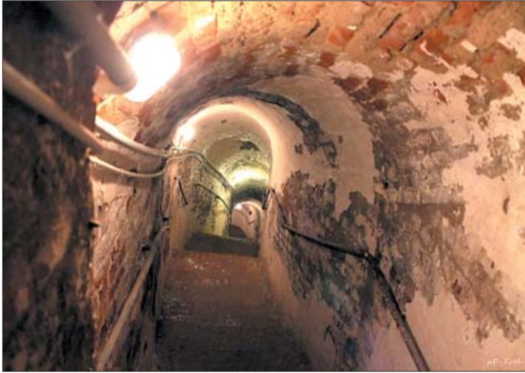
Harminc méter a legnagyobb mélysége.

negyvenes évektől folyt a településen olajipari termelés. A II. világháború alatt az itt élők és dolgozók használták is ezeket a menedékhelyeket, amikor megérkeztek az amerikai légi bombázók. Egy komplexebb óvóhely tervezésének gondolata az 1950-es évek elején vetődött fel. Kiderült, hogy a korábban épített helyiségek kifogástalan állapotban vannak, így gyakorlatilag ezek köré épült fel a most is látható bunker – mondja Jánosi Ferenc.