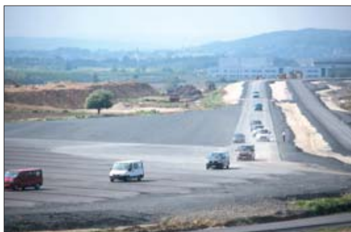
Az érdeklődőket csoportbontásban kisbusszokkal vitték körbe. A fotón éppen a dinamikus felülethez érkeznek.

pálya, de azok az önvezető járművek vizsgálatára nincsenek felkészítve. Egyedülálló a Smart City is, ami városi közlekedési környezetet szimulál. Ilyesféle tesztelés az önvezető autók számára a világban csak az USA-ban van. Az európai tesztpályák között a zalaegerszegin épült meg a legnagyobb kör alakú dinamikus felület, a maga 300 méteres átmérőjével. (Folytatás a 4. oldalon.)