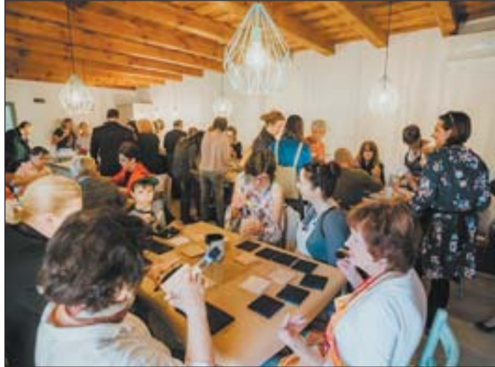
A Páhoki Kapo(I)cs Alkotóház megnyitóján

ket, civil szervezeteink tagjait, a közeli települések lakosait és a környékbeli szállodák vendégeit egyaránt várjuk ezekre a programokra. Az épület alkalmas iskolai programok megvalósítására is. Az alkotóházzal közelebb kerültünk az általunk megálmódott faluközpontokhoz, amelynek szerves része a mellette lévő helyi termék bolt, szemben pedig az éppen megújuló hivatal.