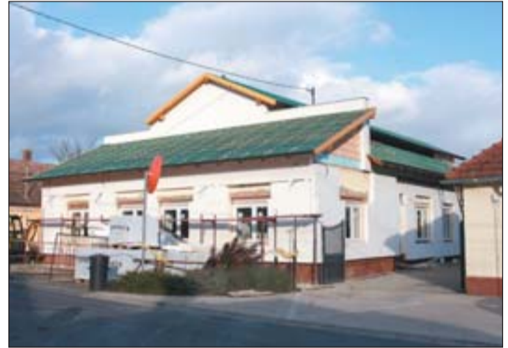
Zajlik az önkormányzati hivatal felújítása