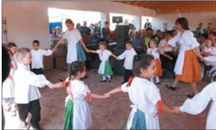
A helyi óvodások táncos műsora

A hajnalig tartó Márton-napi műsoros, libacomb vacsorás rendezvényünkre száznál többen voltak kíváncsiak. Várhatóan december 19-én pedig, békességet hirdető, a karácsonyi műsoros este, a hatvan év felettieket vendéglük meg fehér asztalok mellett, ajándékutalvány átadásával.