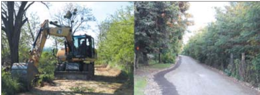
Az utak összekötnek, az árkok szétválasztanak

Az Energy Globe Magyarország 2018 díjas Nagypáli megvalósult és tervezett fejlesztéseiről a médiából és a www.nagypali.hu weboldalon tájékozódhatnak.