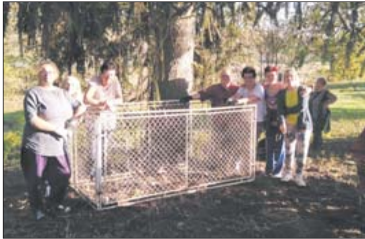
Önkéntes munka a temetőben

– A kistelepülések előbbre jutásának biztosítéka a Magyar falu program, melyre mi is több pályázatot nyújtottunk be. Eredményre várunk az egyházközséggel közös pályázatunk, mely közel 20