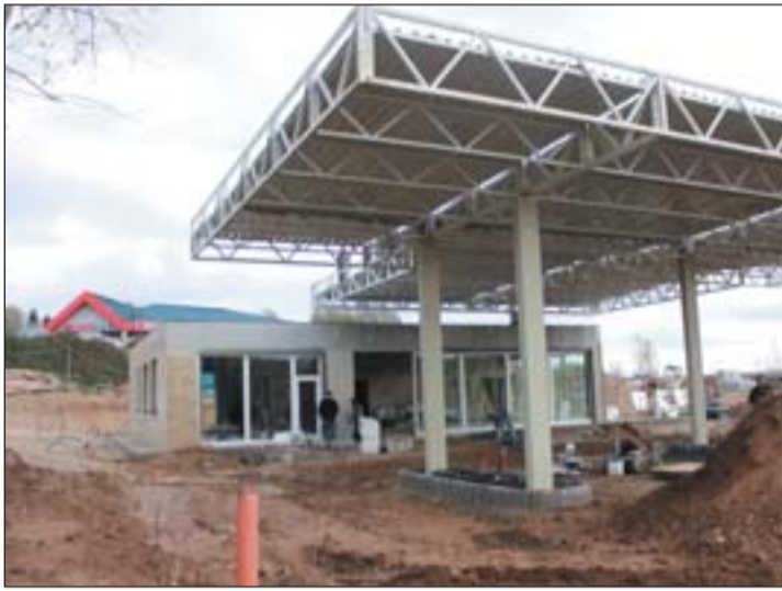
Épül a benzinkút az alsópáhoki Spar áruház szomszédságában

– Nem múzeumot, vagy helytörténeti gyűjteményt szeretünk volna létrehozni, ami bemutatja a régi eszközöket, hanem egy szellemi műhely, ahol alkotni lehet. Berendezései is ezt tükrözik, amelyek egy bútorfestő és egy textil díszítő alkotótáborban készültek. Régi asztalokat,