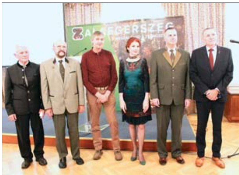
A vadászati konferencia résztvevői.

hiszen érdekesek, mások is felfigyeltek rá, illetve tanulsággal szolgálnak. Az Őseink vadászöröksége című második fejezetben „történelmi igazságokra” világít rá. Hogy a kötet hátborzítóan írja: célom az volt, „hogy felkeltem és ráirányítsam érdeklődő vadásztársaim figyelmét a vadászat és történelmünk kapcsolatára, történelmünk több, méltatlanul mellőzött, elhallgatott vagy tudatosan félremagyarázott eseményére, és a magyarság legnagyobb kincsére: őseink hagyatékára.” A vadászat Zala megyében olyan hagyaték, amire építeni lehet,