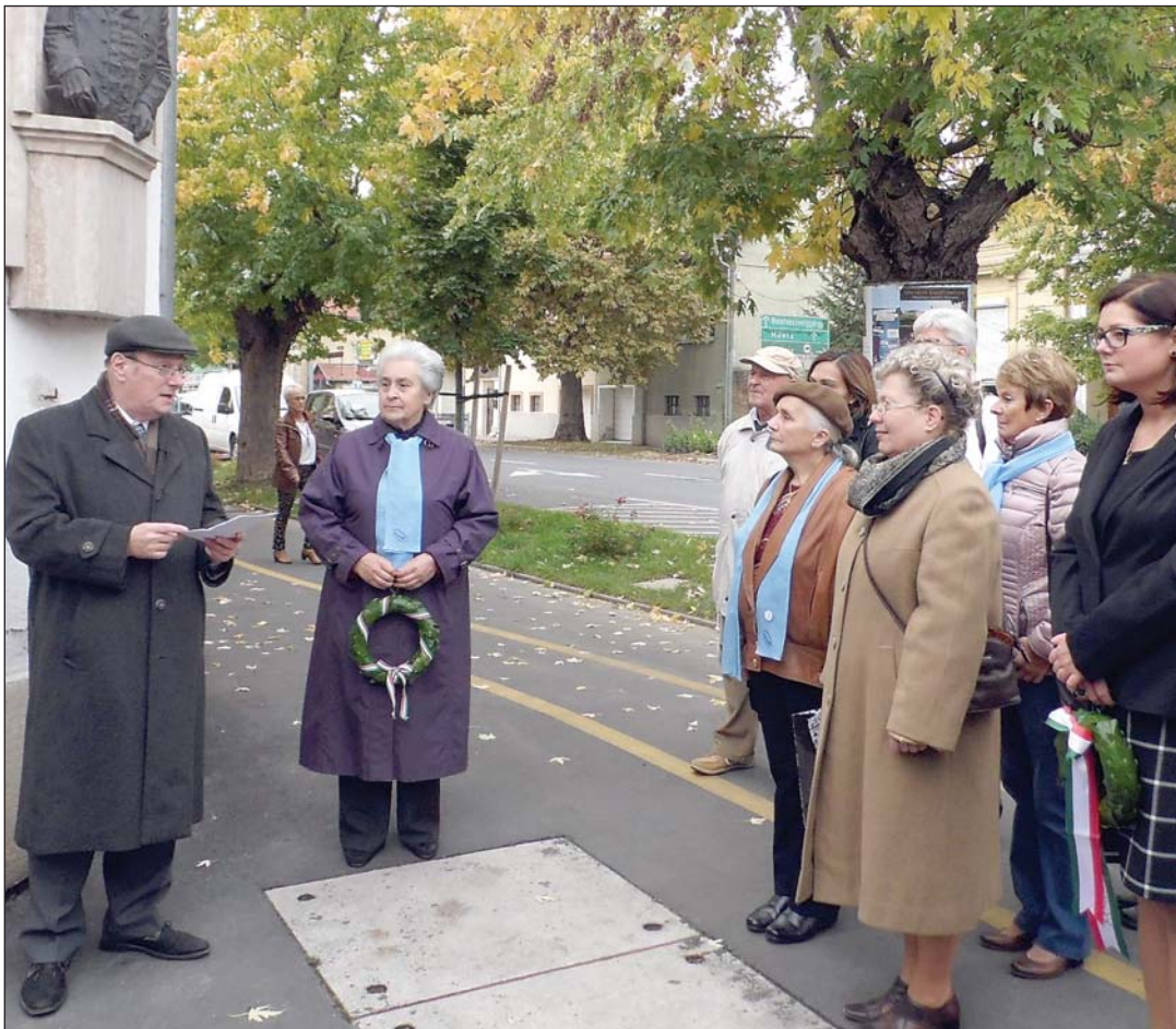
Koszorúzási ünnepséggel emlékezett a napokban Deák Ferencre Keszthelyen a Nők a Balatonért Egyesület zalai csoportja.