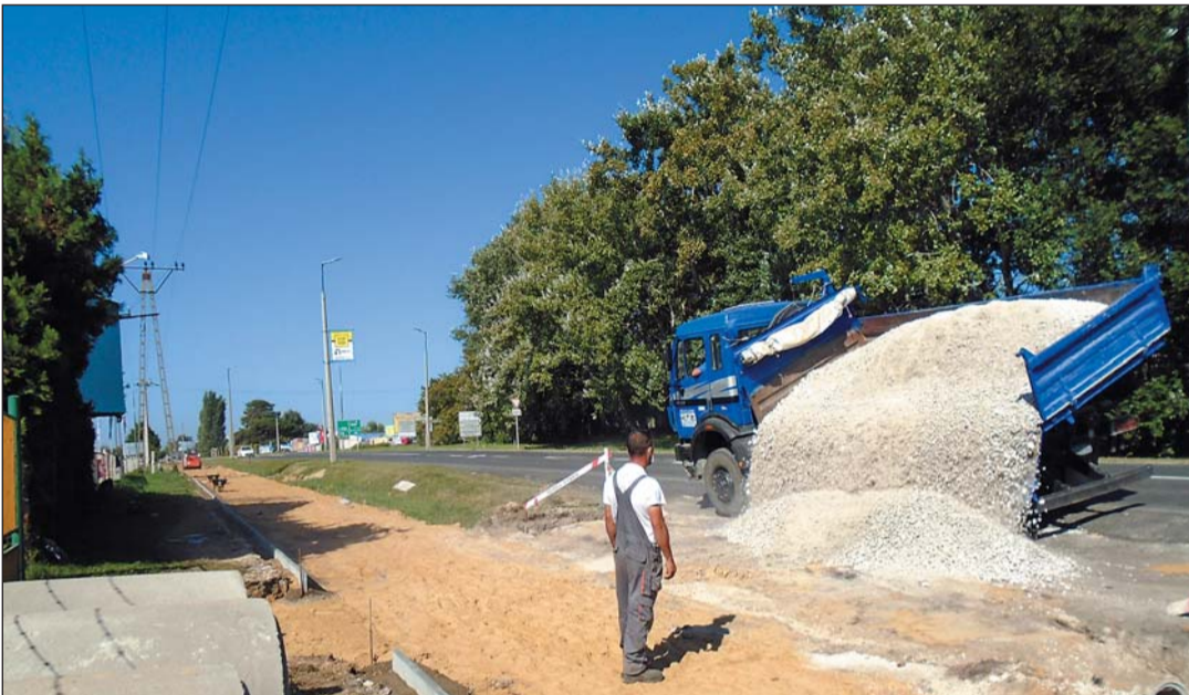
Keszthely város északi részén, a Csapás út több szakaszán folyamatosan dolgoznak a munkagépek, gőzerővel épül a kerékpárút-hálózat új, három kilométer hosszúságú szakasza.

A „Zala két keréken – Kerékpárút-fejlesztés Keszthely, Hévíz és Hahót településen” címet kapott, 2016-ban startolt projekten szerzett 324,38 millió forintból, a Zala Megyei Önkormányzat beruházásában, az érintett településekkel konzorciumban folytatódik a beruházás, melynek révén megvalósul Keszthely és Gyenesdiás bringás összekötése.