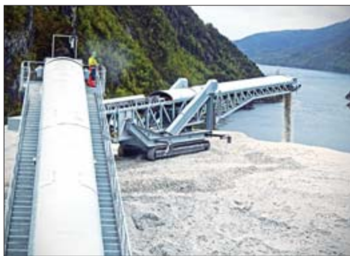
Hajórakodó állomás, Norvégia.

A világ minden részén lassan megoldhatatlan problémát jelent a kommunális hulladékok folyamatosan növekvő mennyisége. A közép-európai országokban ennek a hulladéknak mintegy 80–90 százaléka lerakóba kerül. A 2016-ban a GINOP-2.1.1. felhívásnak sikeresen elnyert pályázatnak köszönhetően a 3B Hungária egyrészt több innovatív fejlesztést tudott megvalósítani, ezeknek is köszönhetően jelentősen bővült a cég profilla, másrészt pedig a Szabadics Zrt.-vel konzorciumban a Zalaegerszegi Önkormányzat támogatásával a városban létrehozott egy referenciaüzemet, ahová az általuk újonnan