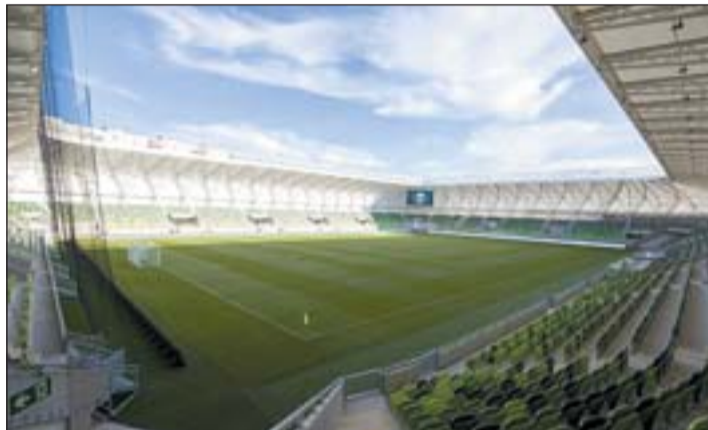
A Haladás új stadionja Szombathelyen.

– Ez a 143 milliárdos bekerülési költségével valóban egy gigaprojekt, amit a Magyar Építő Zrt.-vel konzorciumban valósítunk meg 50–50 százalékban. Jelenleg 500 szerkezetépítő dolgozik, 13 óriás toronydarúval és 5 mobilidarúval. Ez egy ultraszuper, 65 ezer főt befogadó stadion lesz, óriási parkokkal, kiegészítő építményekkel, terekkel. A beruházással 2019 novemberében kell elkészülnünk, ugyanis november 25-én az 1953-as, az angolok feletti, londoni 6-3-as győzelem emléknapiján a tervek szerint magyar–angol nyitómeccsel adják át hazánk új futballszentélyét – zárta a beszélgetést Istenes István.